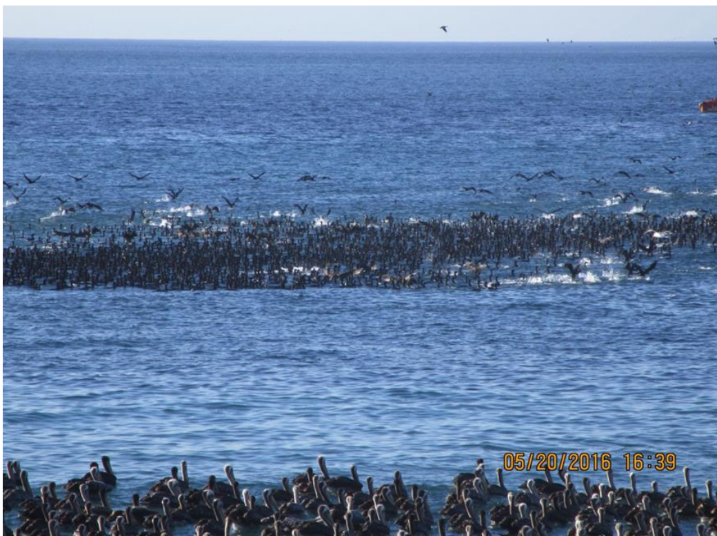
Figura 1. Interacción de los predadores con los cardúmenes de anchoveta

Es importante mencionar que, la dinámica observada dentro de la Bahía de Mejillones es un ejemplo clásico de cómo se comportan los cardúmenes de anchoveta en un ambiente con condiciones adecuadas y que interactúan según sus ciclos biológicos ( Figs. 1 y 2 ). Comportamiento similar está ocurriendo en el sector sur de la caleta “La Cuchara”, cercana a Tocopilla, donde la bahía tiene una disposición geográfica hacia el norte, formando un acantilado con playa de roca y sin actividad antropogénica ( Anexo II ).