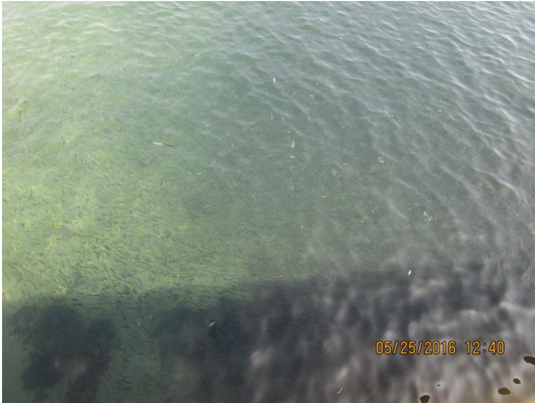
Figura 2. Cardúmenes de anchoveta dentro de la Bahía de Mejillones

Durante la presente semana se seguirá con el monitoreo en la Bahía de Mejillones con la misma grilla, para seguir la evolución de la condiciones oceanográficas, centrándose principalmente en la concentración de oxígeno en la columna de agua.