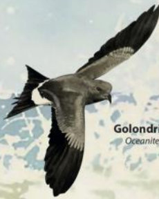
Golondrina de mar Oceanites oceanicus