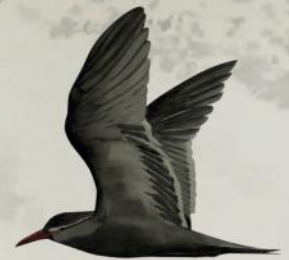
Gaviotín Monja Larosterna inca