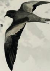
Golondrina de mar negra Oceanodroma markhami