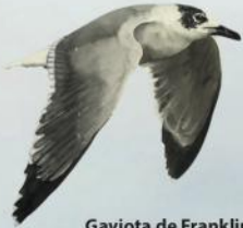
Gaviota de Franklin Leucophaeus pipixcan