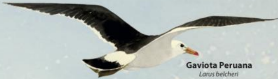
Gaviota Peruana Larus belcheri