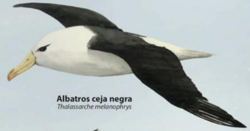
Albatros ceja negra Thalassarche melanophrys