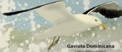
Gaviota Dominicana Larus dominicanus