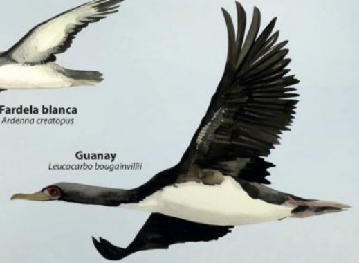
Guanay Leucocarbo bougainvillii