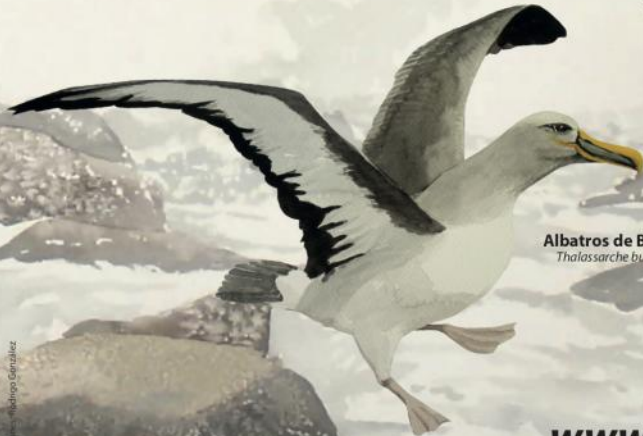
Albatros de Buller Thalassarche bulleri