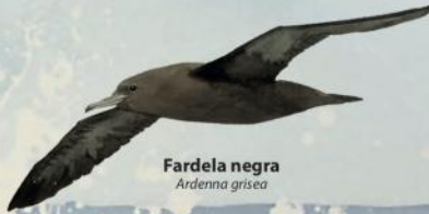
Fardela negra Ardenna grisea