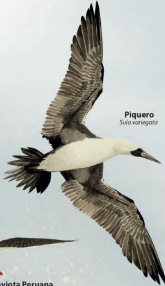
Piquero Sula variegata