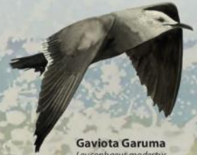
Gaviota Garuma Leucophaeus modestus