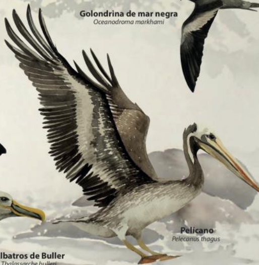
Pelicano Pelecanus thagus