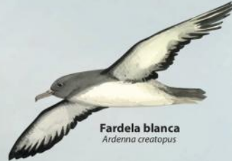
Fardela blanca Ardenna creatopus