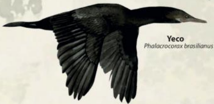
Yeco Phalacrocorax brasilianus